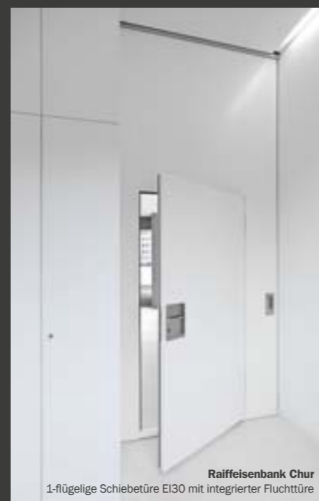
Raiffeisenbank Chur 1-flügelige Schiebetüre EI30 mit integrierter Fluchttüre