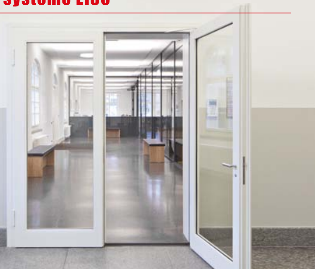
Tele1 Studios Luzern 2-flügelige Schallschutztüre EI30