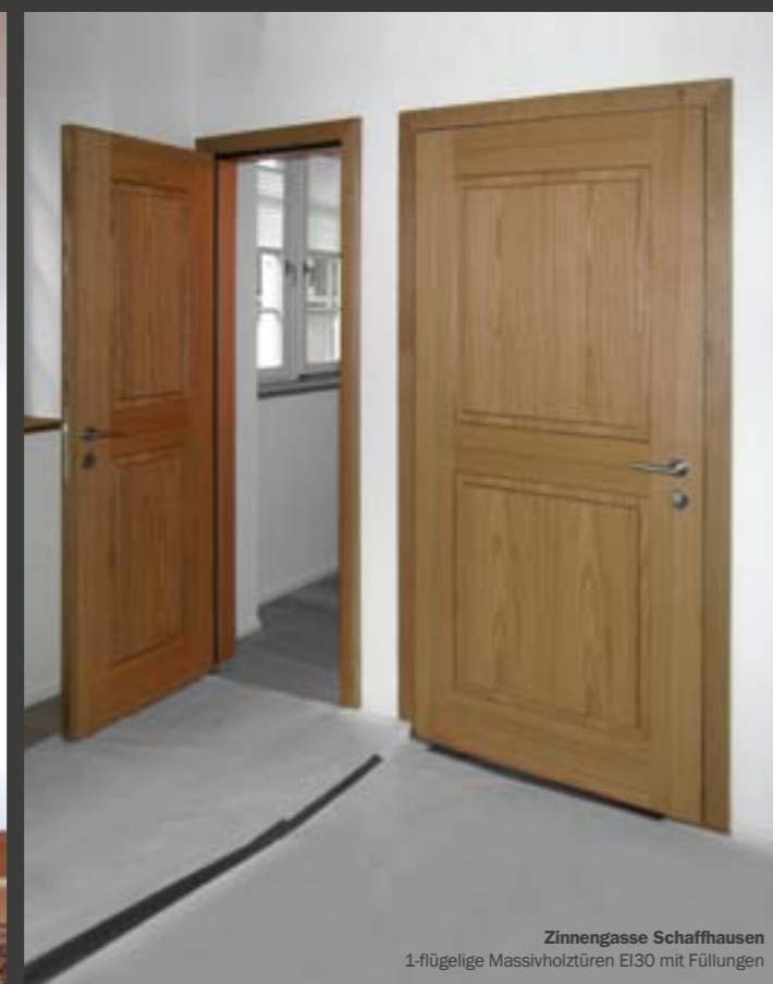
Zinneggasse Schaffhausen 1-flügelige Massivholztüren EI30 mit Füllungen