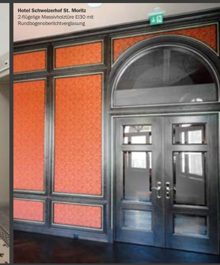
Hotel Schweizerhof St. Moritz 2-flügelige Massivholztüre EI30 mit Rundbogenoberlichtverglasung