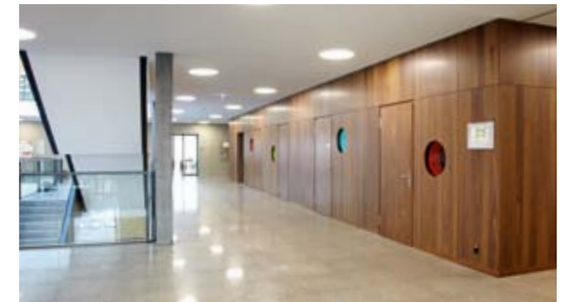
ZAHW Gebäude TH Technik Winterthur 1-flügelige Massivholztür EI30

Gerade bei komplexen Aufgaben sind die ersten Schritte entscheidend für den weiteren Projektverlauf. Dafür können Sie Ausschreibungstexte, Datenblätter und Produktbeschreibungen jederzeit auf www.feuerschutzteam.ch kostenlos downloaden.