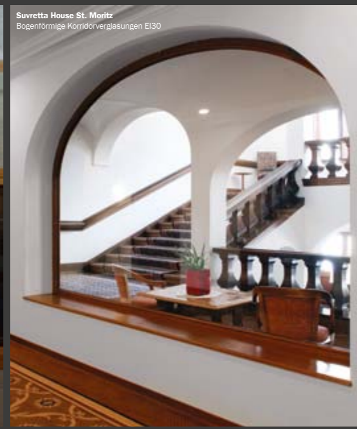
Suvretta House St. Moritz Bogenförmige Korridorverglasungen EI30