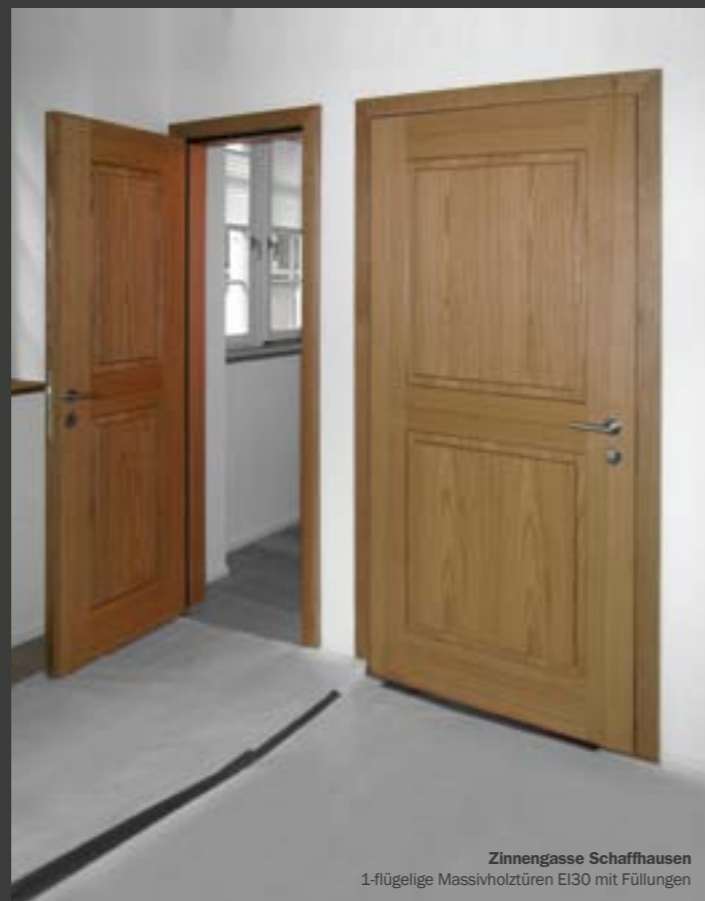
Zinnengasse Schaffhausen 1-flügelige Massivholztüren EI30 mit Füllungen