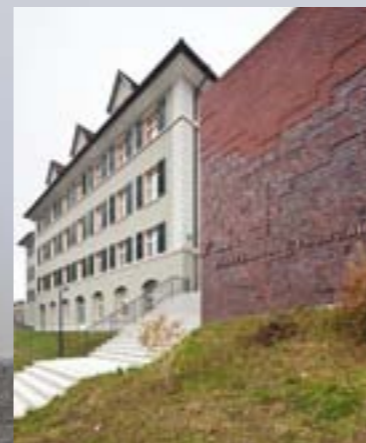
Staatsarchiv Frauenfeld 2-flügelige verglaste Türe EI30, mit integriertem Türschliesser