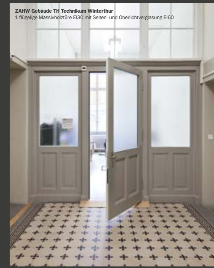
ZAHW Gebäude TH Technikum Winterthur 1-flügelige Massivholztüre EI30 mit Seiten- und Oberlichtverglasung EI60