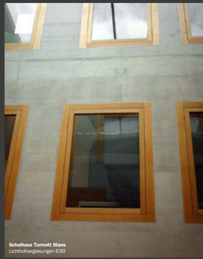
Schulhaus Turmatt Stans Lichtlofverglasungen EI30