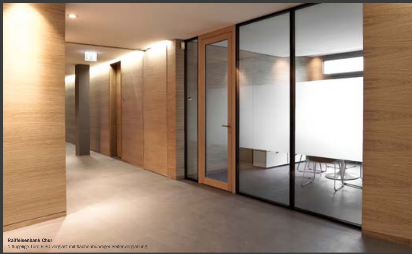
Raiffeisenbank Chur 1-flügelige Türe EI30 verglast mit flächenbündiger Seitenverglasung