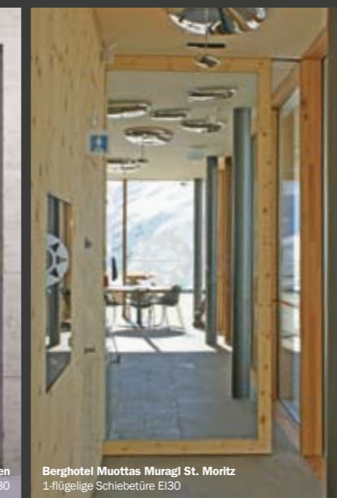
Berghotel Muottas Muragl St. Moritz 1-flügelige Schiebetüre EI30