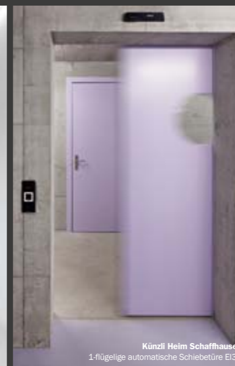
Künzli Heim Schaffhausen 1-flügelige automatische Schiebetüre EI30