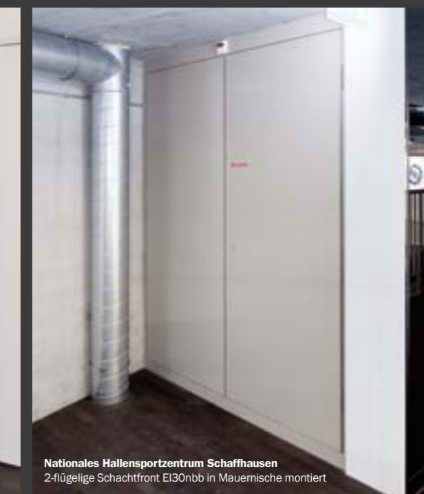
Nationales Hallensportzentrum Schaffhausen 2-flügelige Schachtfront EI30nbb in Mauermische montiert