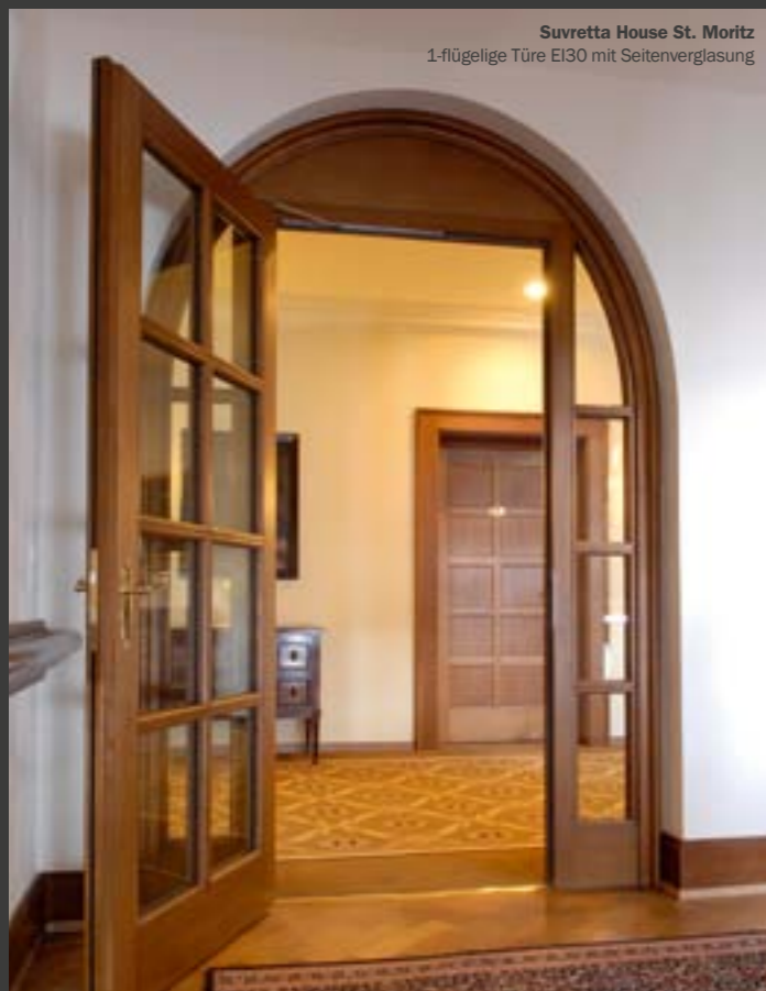
Suvretta House St. Moritz 1-flügelige Türe EI30 mit Seitenverglasung