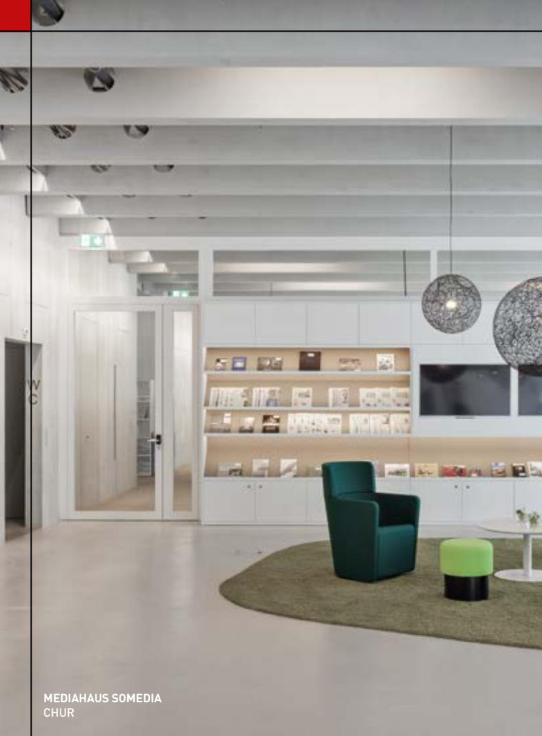
MEDIAHAUS SOMEDIA CHUR