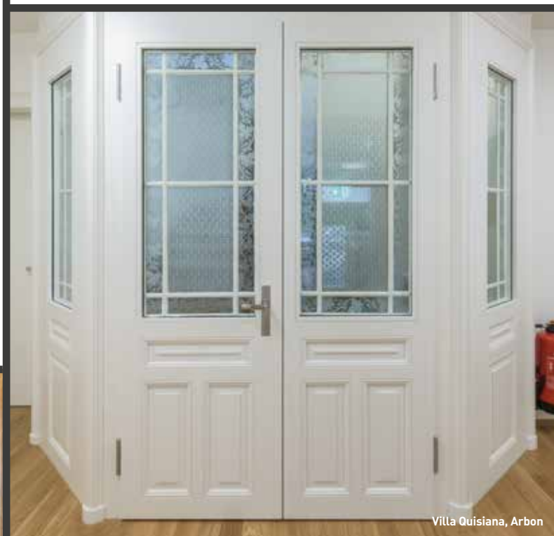
Villa Quisiana, Arbon