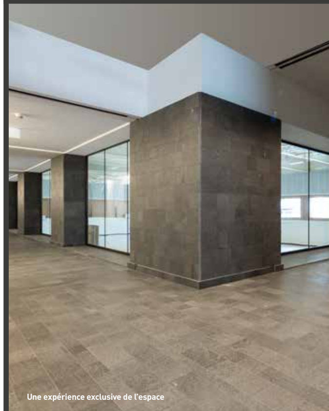
Une expérience exclusive de l'espace