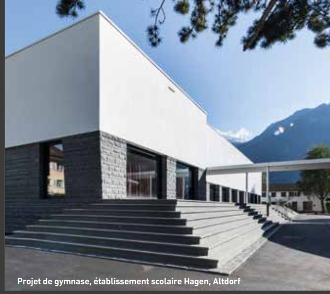
Projet de gymnase, établissement scolaire Hagen, Altdorf