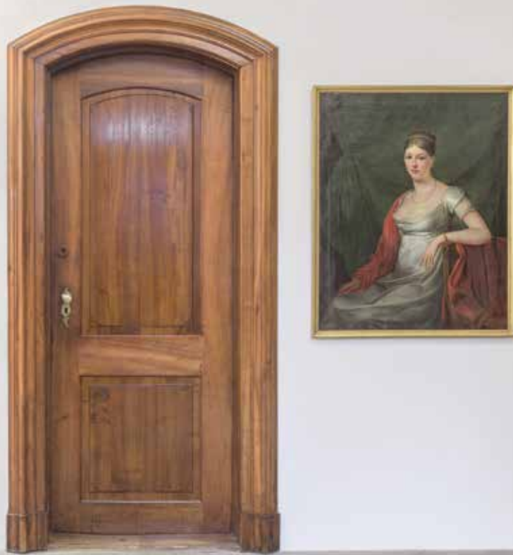
Porte classée monument historique dans la maison sur le Rechberg, Zurich