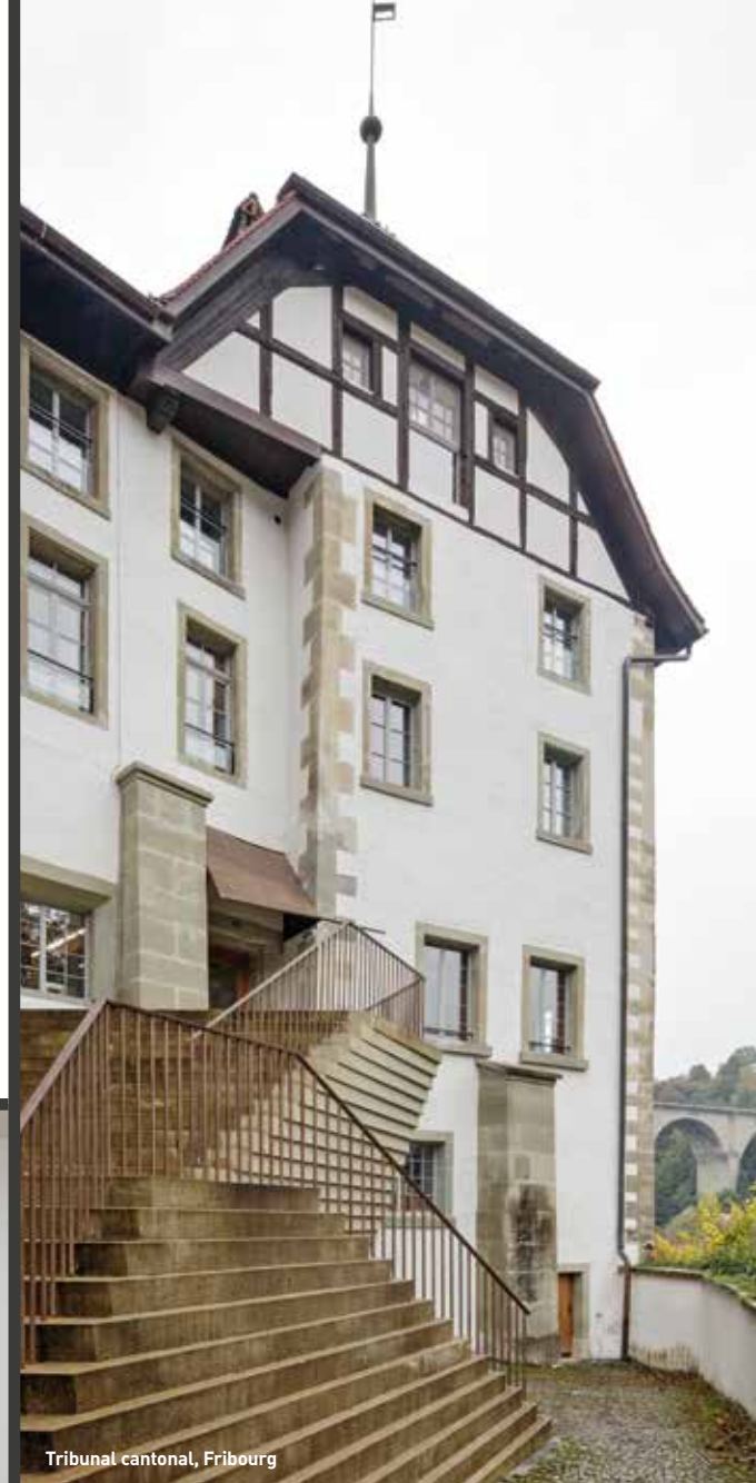
Tribunal cantonal, Fribourg